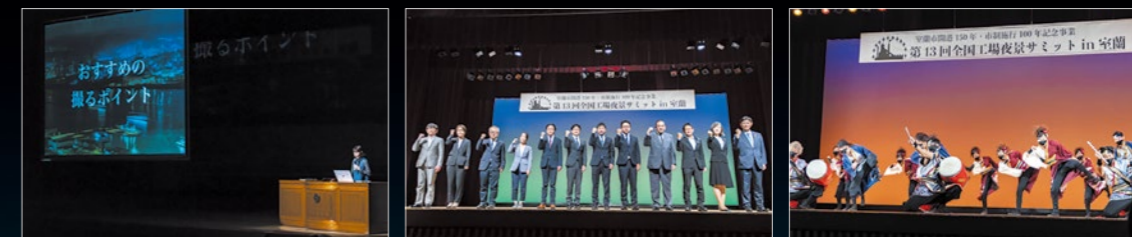
2022年10月1日開催「第13回 全国工場夜景サミット in 室蘭」の様子

2011年2月23日、他都市に先駆けて工場夜景の活用に取り組んできた、室蘭市、川崎市、四日市市、北九州市の4都市が連携して、工場夜景観光の魅力と可能性を探る「第1回全国工場夜景サミット」を川崎市にて開催しました。その後、全都市で連携しながら、年に1回、全国工場夜景サミットを開催しています。