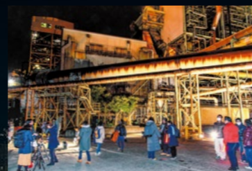
工場夜景ツアーの様子

このゴールデンタイムに合わせて、各地で工場夜景ツアーが実施されています。バスやタクシーで夜景観賞スポットを案内してくれるものや、海上から観賞するクルージングツアーなど、その種類も豊富です。最近では、SNSに画像をアップすることを目的とした方々を集めた、撮影ツアーなども人気です。