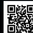
全国工場夜景都市協議会 ホームページ

2011年2月、川崎市の呼びかけで開催された「第1回全国工場夜景サミット」において、工場夜景観光を核とした地域活性化を図ろうとする室蘭市、川崎市、四日市市、北九州市の4都市が共に連携することで、全国的な大きなうねりにすることを誓い、「日本四大工場夜景」を宣言しました。その後、志を共にする周南市、尼崎市、富士市、千葉市、堺市、高石市、市原市、東海市、飛鳥村が加わり、全13都市となりました。今後も各都市では、地域資源に磨きをかけながら、共に工場夜景の美しさや力強さなど、その魅力を全国に向けて発信し続けることにより、さらなる工場夜景観光の発展に尽力してまいります。そして、観光客を誘致し、滞在型観光の推進による地域振興を図るため、相互交流と協力を推進するとともに、工場夜景への取り組みを全国に広めるべく活動を続けてまいります。